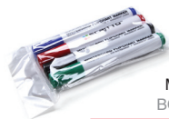
MARKER PENS BOARDMARKER