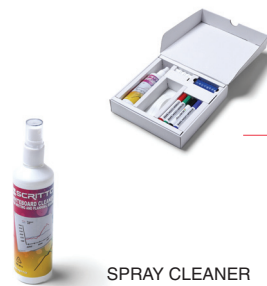
SPRAY CLEANER REINIGER