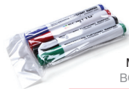
MARKER PENS BOARDMARKER