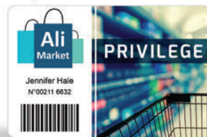
Tarjetas de fidelidad