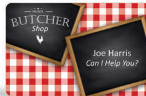
Tarjetas identificativas para empleados