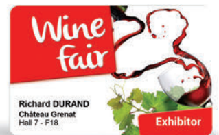
Invitaciones a eventos